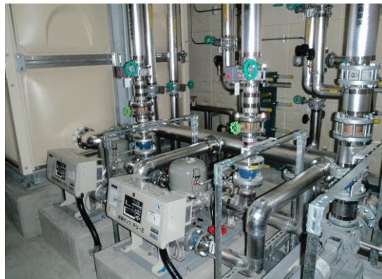
健康づくりセンター屋内プール