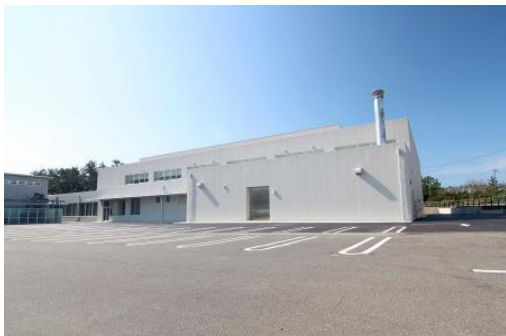
健康づくりセンター屋内プール